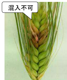
赤かび病被害粒 (混入限度0.0%)